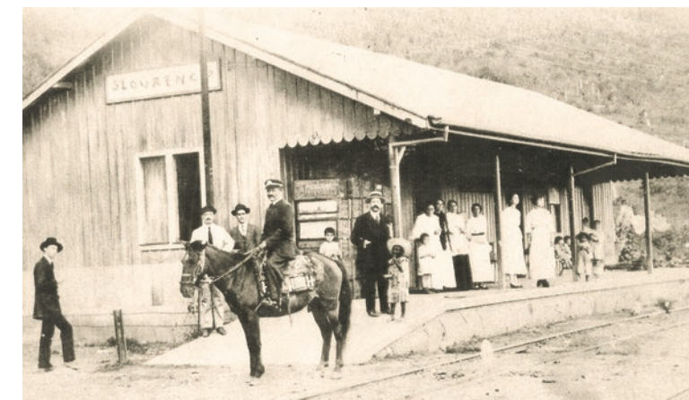
ANTIGA ESTAÇÃO FERROVIÁRIA EM 1900

Assim, com a instalação da empresa de águas, com o trajeto de urbanização e a presença de uma estação ferroviária, São Lourenço tornou-se uma famosa estância hidromi-