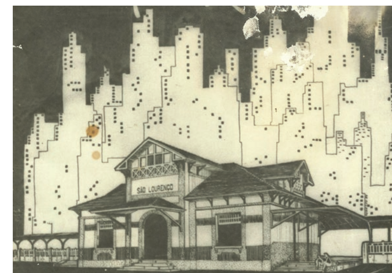
ILUSTRAÇÃO QUE MOSTRA A EXPECTATIVA DE CRESCIMENTO DA CIDADE