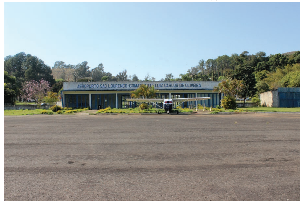
CLASSIFICADA NO 2º CONCURSO CULTURAL DE ARTES VISUAIS DE SÃO LOURENÇO, EM 2019

firmar e atestar sua importância histórica dentro do contexto de modernização municipal, bem como símbolo de um dos eixos da política estado-novista, relevante para a tessitura urbana de São Lourenço e as práticas culturais da cidade. Seu estilo arquitetônico e implantação conferem certo destaque à construção, e, reconhecer o valor cultural desse bem, significa ultrapassar a descrição de suas características físicas, que perduram ao longo de todas essas décadas, lançando luzes também para a representatividade da edificação na história e entre as memórias dos cidadãos.