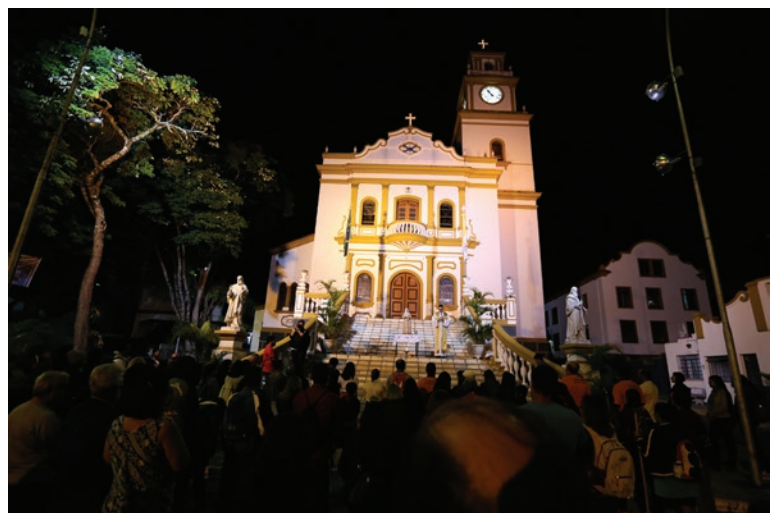
A PEREGRINAÇÃO TEM INÍCIO NA BASÍLICA DE SÃO LOURENÇO MÁRTIR, QUANDO O PADRE REALIZA UMA CERIMÔNIA PARA ABENÇOAR OS FIÉIS DURANTE A CAMINHADA

Nos primeiros anos a organização estabelecia o amanhecer como horário de partida, no entanto, com o crescimento do número de peregrinos e com as primeiras missas em Baependi sendo celebradas logo cedo, muitos fiéis estabeleceram a caminhada