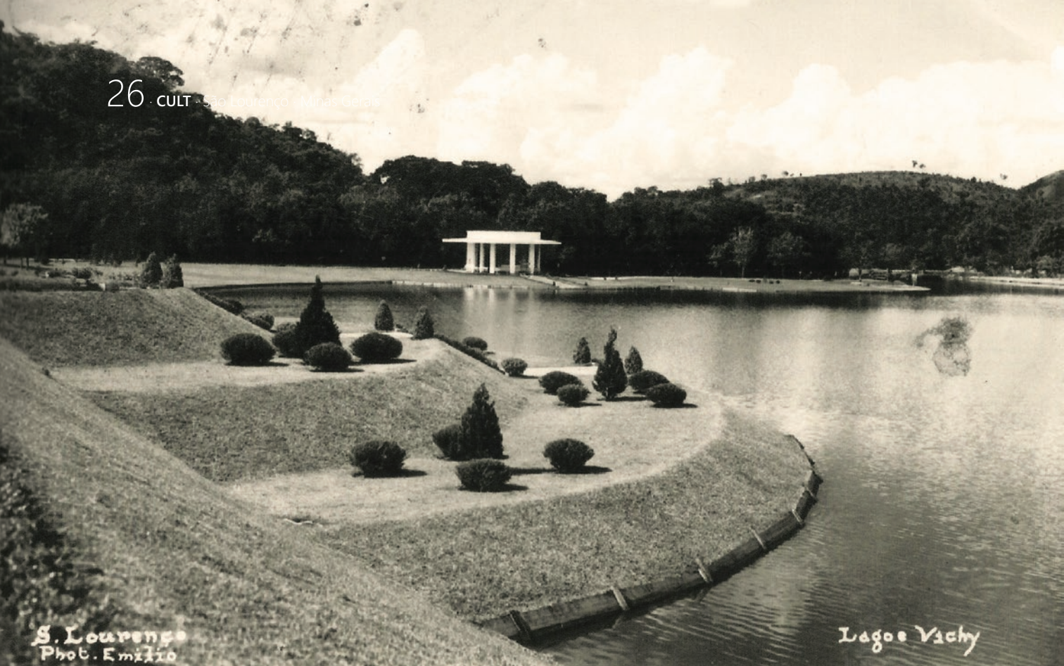
PARQUE DAS ÁGUAS COM A FONTE VICHY AO FUNDO NA DÉCADA DE 1940