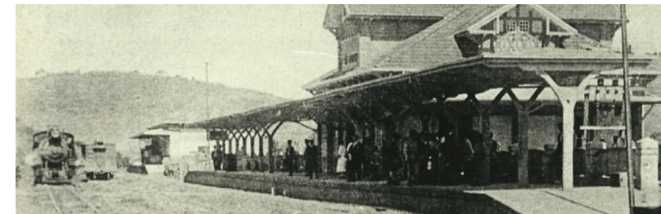
ESTAÇÃO FERROVIÁRIA DE SAO LOURENÇO PG 4