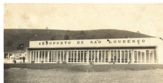
AEROPORTO COMANDANTE LUIZ CARLOS DE OLIVEIRA PG 22