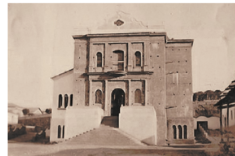
FOTO DA DÉCADA DE 1940, DURANTE A CONSTRUÇÃO DA BASÍLICA

É preciso destacar que o distrito de São Lourenço foi criado com a Lei Estadual nº2, de 14 de Setembro de 1891, ocasião em que ainda era integrante do município de Silvestre Ferraz (atual Carmo de Minas). Depois, foi transferido para o Município de Pouso Alto, pela Lei Estadual nº 843, de 7 de Setembro, de 1923. Já a emancipação de São Lourenço só aconte-