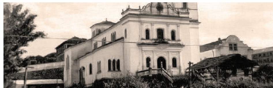
BASÍLICA MENOR DE SÃO LOURENÇO MÁRTIR PG 8