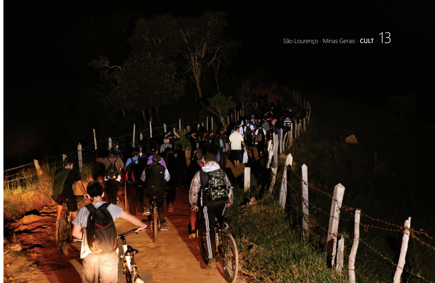
A FÉ MOVE MULTIDÕES. TODOS OS ANOS, DURANTE A MADRUGADA DE 1º DE MAIO, MILHARES DE FIÉIS PERCORREM O TRAJETO DE 33KM ENTRE SÃO LOURENÇO E BAEPENDI, RUMO AO SANTUÁRIO DE NOSSA SENHORA DA CONCEIÇÃO, A CASA DE NHÁ CHICA

e promoveu o tombamento em 2018, com o apoio do Conselho Municipal do Patrimônio Cultural, através da inscrição nº 4 de 23 de Março de 2018, no livro do Tombo Municipal, do referido bem, enaltecendo e louvando sua importante função social e seu valor histórico e afetivo para a cidade de São Lourenço, desde sua nascente.