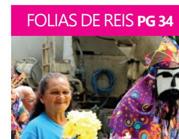
FOLIAS DE REIS PG 34