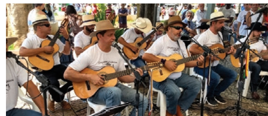
ORQUESTRA DE VIOLEIROS PG 19