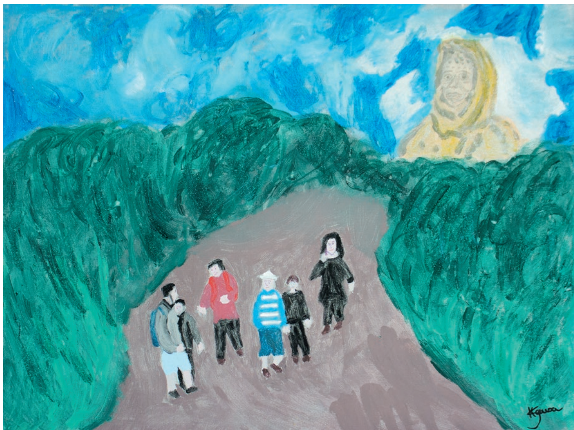
PINTURA EM TELA DE KARLA RODRIGUES DE SOUZA, CLASSIFICADA NO 2º CONCURSO CULTURAL DE ARTES VISUAIS DE SÃO LOURENÇO, EM 2019

ção”, a pequena igreja acolhe peregrinos de diversas partes do Brasil. Muitos fiéis que visitam o lugar pedem graças e oram com fé. Atualmente, no “Registro de graças do Santuário” estão registradas 20.000 graças alcançadas por intercessão de Nhá Chica.