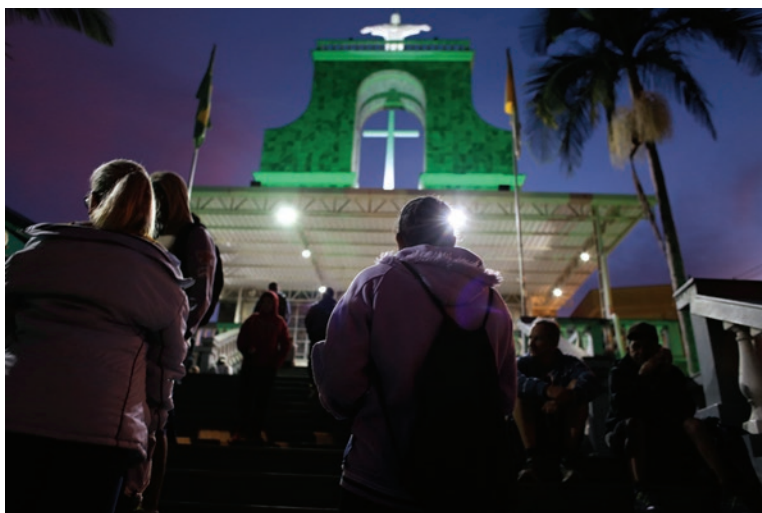
OS FIÉIS COMEÇAM A CHEGAR AINDA DURANTE A NOITE NO SANTUÁRIO, EM BAE-PENDI, ONDE ACONTECEM DIVERSAS MISSAS DURANTE TODO O DIA