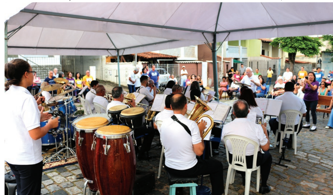
APRESENTAÇÃO DA SOCIEDADE MUSICAL ANTÔNIO DE LORENZO EM FRENTE À SEDE DA BANDA, EM 2019