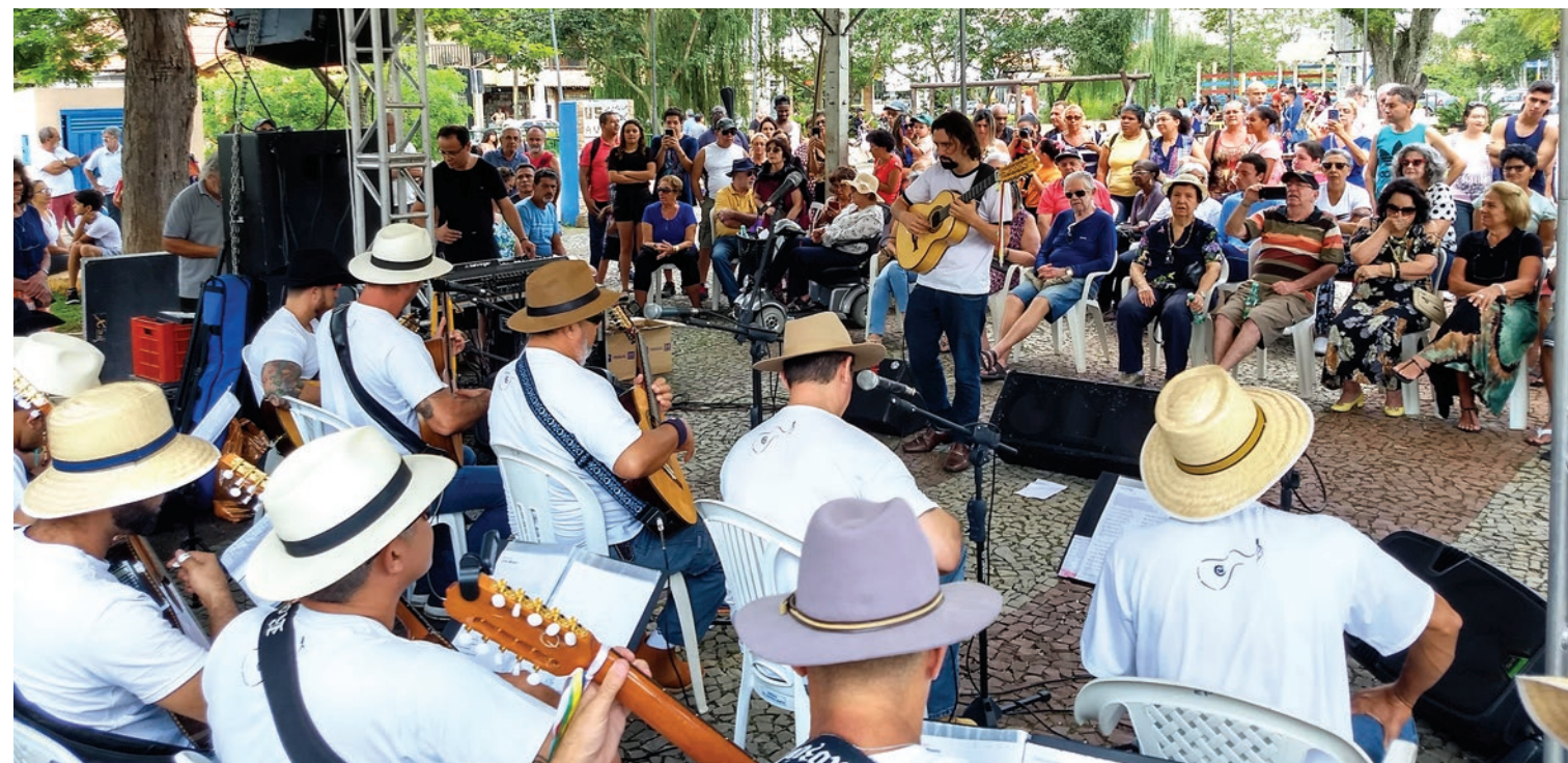
APRESENTAÇÃO DA ORQUESTRA DE VIOLEIROS, NA PRAÇA JOÃO LAGE, DURANTE O ANIVERSÁRIO DE SÃO LOURENÇO, EM 1º DE ABRIL DE 2019

Um dos mais populares instrumentos musicais no Brasil, a viola é frequentemente identificada com o termo caipira ou por denominações como viola de dez cordas, viola sertaneja, viola cabocla, entre outras (PINTO, 2008).