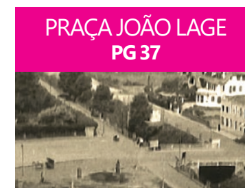
PRAÇA JOÃO LAGE PG 37