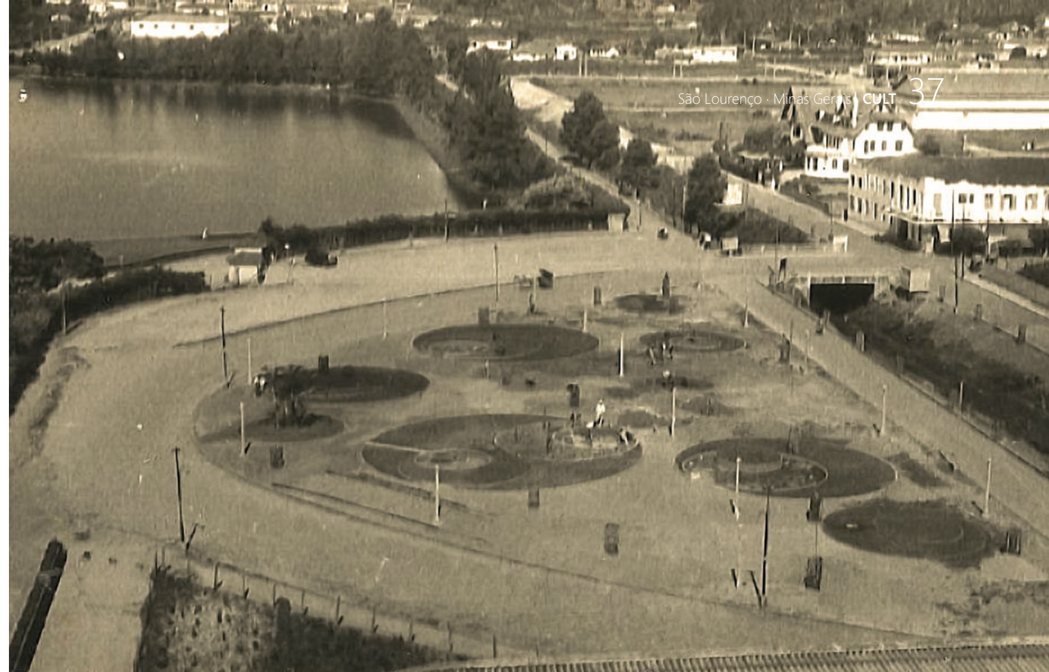
PRAÇA JOÃO LAGE NA DÉCADA DE 1960, QUANDO TINHA O APELIDO DE PRAÇA BAMBOLÊ