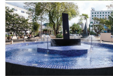
FOTOGRAFIA DE LUCIANE GUIRLANDA, CLASSIFICADA NO 2º CONCURSO CULTURAL DE ARTES VISUAIS DE SÃO LOURENÇO, EM 2019

pequena estrutura coberta, busto do Dr. Eurípedes da Costa Prazeres; marco comemorativo dos 50 anos da Loja Maçônica Rui Barbosa e um outro localizado no centro da Praça, que consistem em uma bíblia aberta - em bronze - com mensagens bíblicas colocados na gestão do prefeito Tenório Cavalcanti.