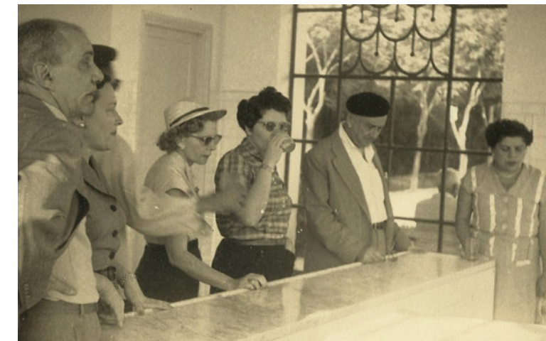
GRUPO DE VERANISTAS NA FONTE VICHY EM 1925

A Fonte Vichy se tornou símbolo da cidade já durante as décadas de 1930 e 1940, quando o Parque das Águas construiu a maior parte de seu conjunto estético, que é rodeada por jardins e pelo belo lago que o geólogo Andrade Júnior julgou ser a melhor solução para o equilíbrio da pressão hidrostática. Construiu-se, desse