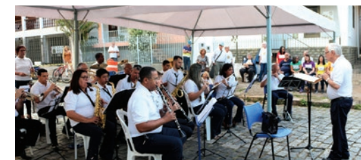
SOCIEDADE MUSICAL ANTÔNIO DE LORENZO PG 30