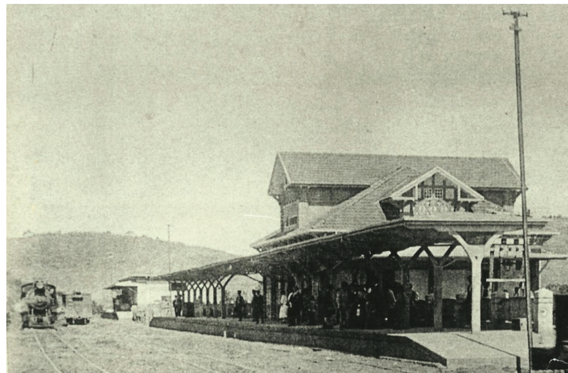
VISTA DA ESTAÇÃO FERROVIÁRIA DE SÃO LOURENÇO DURANTE A DÉCADA DE 1930