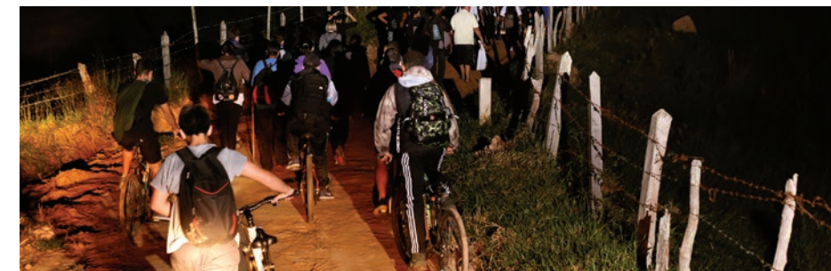
PEREGRINAÇÃO DE NHÁ CHICA PG 13