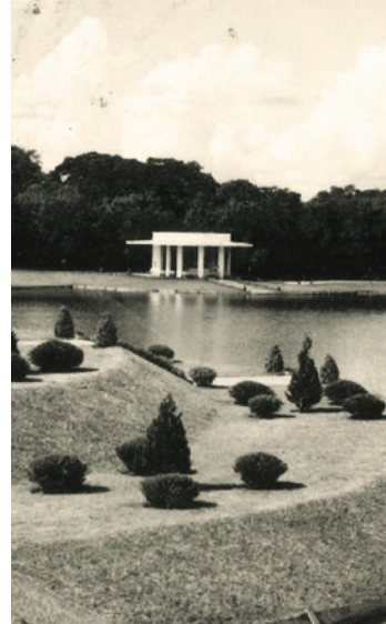
FONTE VICHY PG 26