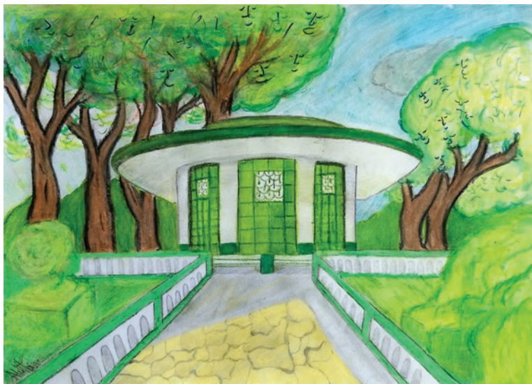
DESENHO EM AQUARELA DE ARIEL TAVARES MONSORES, CLASSIFICADO NO 2º CONCURSO CULTURAL DE ARTES VISUAIS DE SÃO LOURENÇO, EM 2019

A área com duzentos e cinco mil metros quadrados foi ocupada por obras confiadas