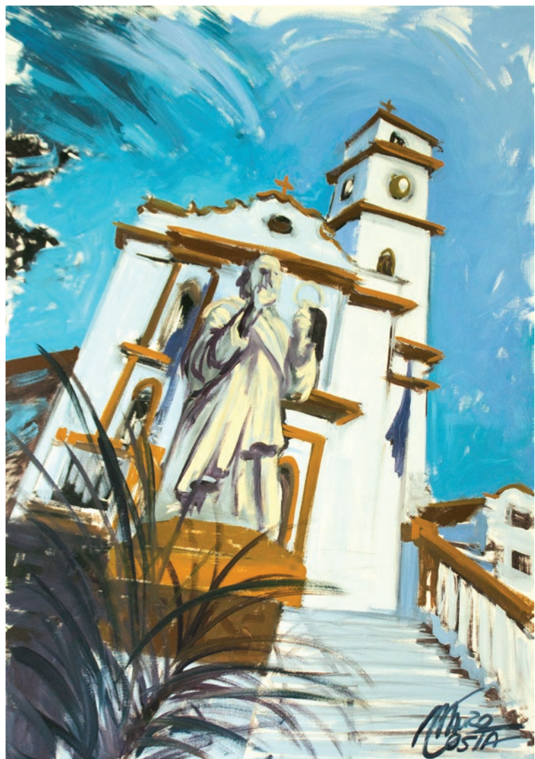
PINTURA EM TELA DE MAURO COSTA, CLASSIFICADA NO 2º CONCURSO CULTURAL DE ARTES VISUAIS DE SÃO LOURENÇO, EM 2019

A igreja Matriz de São Lourenço é um importante bem arquitetônico e histórico, além de excepcional espaço de sociabilidade da cidade de São Lourenço. Sua construção ao longo